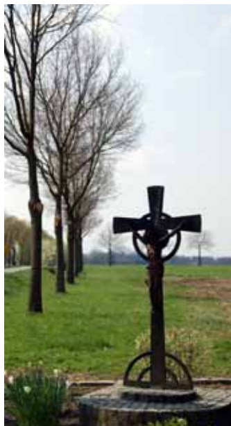
WEGKREUZ, HAUS ALFENS M-BRUCH ▲