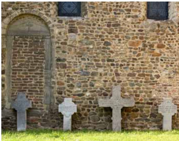
ALTE GRABKREUZE AN DER KIRCHE ▼