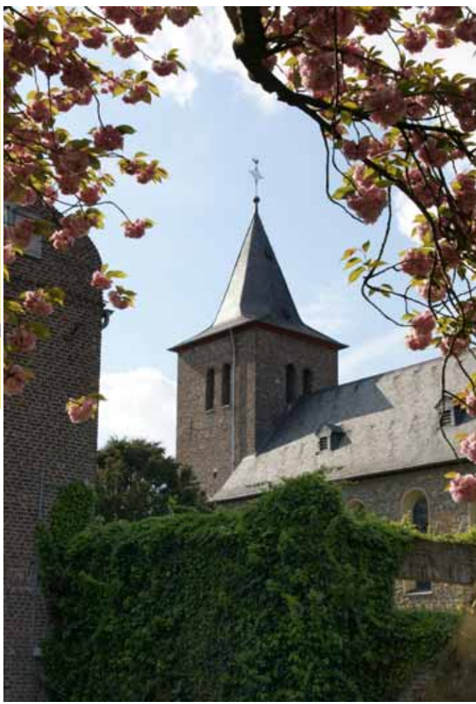
▲ NIKOLAUSKIRCHE MILLEN